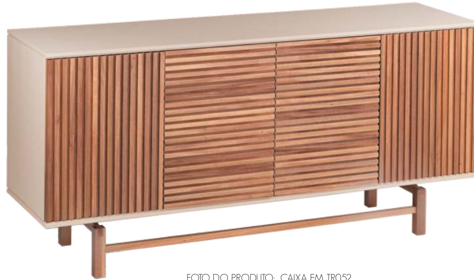
FOTO DO PRODUTO: CAIXA EM TRO52, PORTAS E PÉS EM JEQUITIBÁ NATURAL PRODUCT PHOTO: BOX IN TRO52, DOORS AND FEET IN WOOD JEQUETIBÁ FOTO DO PRODUCTO: CAJA EN TRO52, PUERTAS Y PIES EN JEQUITIBÁ NATURAL