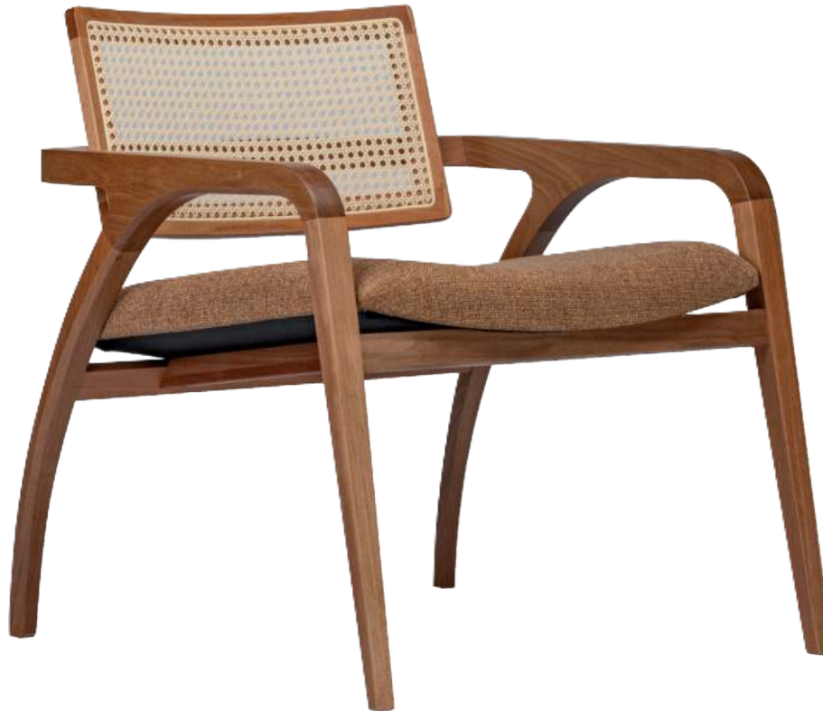
FOTO DO PRODUTO EM JEQUITIBÁ NATURAL TECIDO 0062616 PHOTO OF THE PRODUCT IN JEQUITIBA WOOD FABRIC 0062616 FOTO DEL PRODUCTO EN JEQUITIBÁ NATURAL TEJIDO 0062616

CxPxA / medidas em mm LxDxH / measures in mm CxPxA / medidas en mm