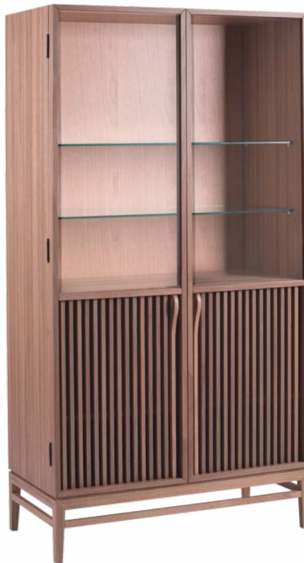
FOTO DO PRODUTO EM JEQUITIBÁ NATURAL PHOTO OF THE PRODUCT IN JEQUITIBÁ WOOD FOTO DEL PRODUCTO EN JEQUITIBÁ NATURAL