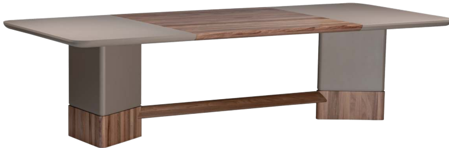
FOTO DO PRODUTO EM JEQUITIBÁ NATURAL + TR080. PHOTO OF THE PRODUCT IN JEQUITIBÁ WOOD + TR080. FOTO DEL PRODUCTO EN JEQUITIBÁ NATURAL + TR080.

CxPxA / medidas em mm LxDxH / measures in mm CxPxA / medidas en mm