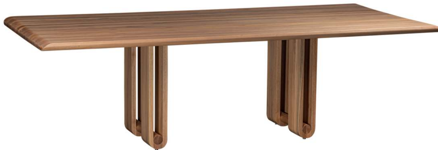
FOTO DO PRODUTO EM JEQUITIBÁ NATURAL PHOTO OF THE PRODUCT IN JEQUITIBÁ WOOD FOTO DEL PRODUCTO EN JEQUITIBÁ NATURAL

CxPxA / medidas em mm LxDxH / measures in mm CxPxA / medidas en mm