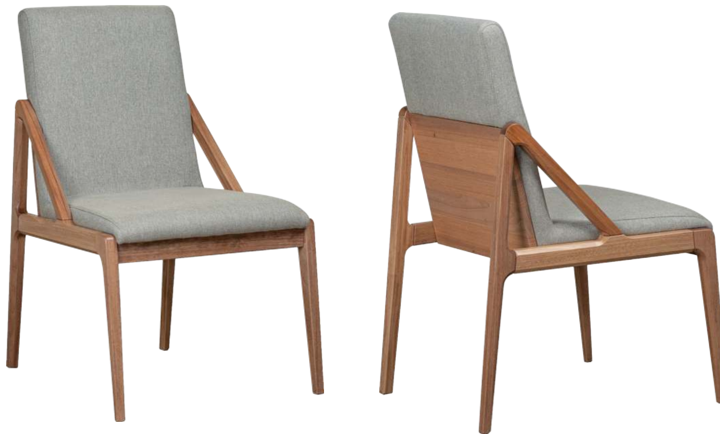
FOTO DO PRODUTO EM JEQUITIBÁ NATURAL TECIDO 0062619 PHOTO OF THE PRODUCT IN JEQUITIBÁ WOOD FABRIC 0062619 FOTO DEL PRODUCTO EN JEQUITIBÁ NATURAL TEJIDO 0062619