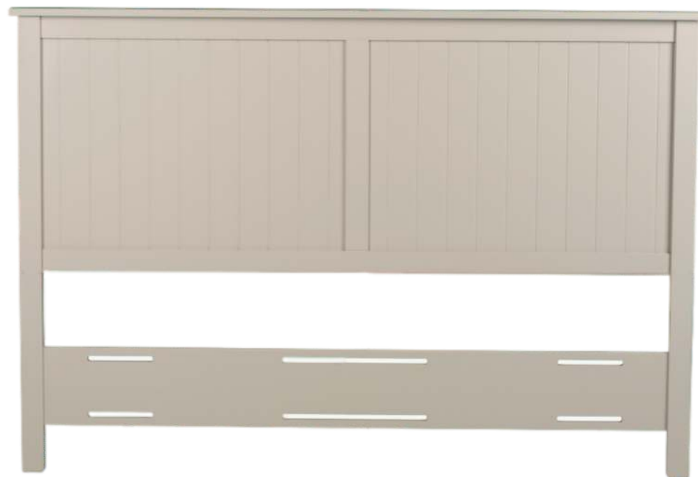
FOTO DO PRODUTO EM MDF TR052 PHOTO OF THE PRODUCT IN MDF TR052 FOTO DEL PRODUCTO EN MDF Tr052