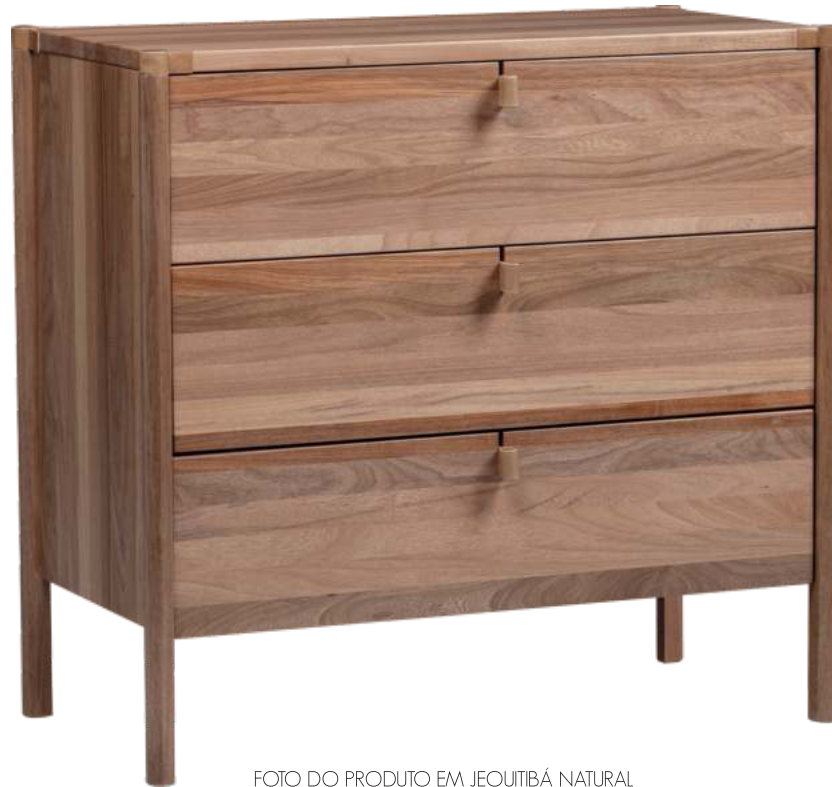
FOTO DO PRODUTO EM JEQUITIBÁ NATURAL PHOTO OF THE PRODUCT IN JEQUITIBÁ WOOD FOTO DEL PRODUCTO EN JEQUITIBÁ NATURAL