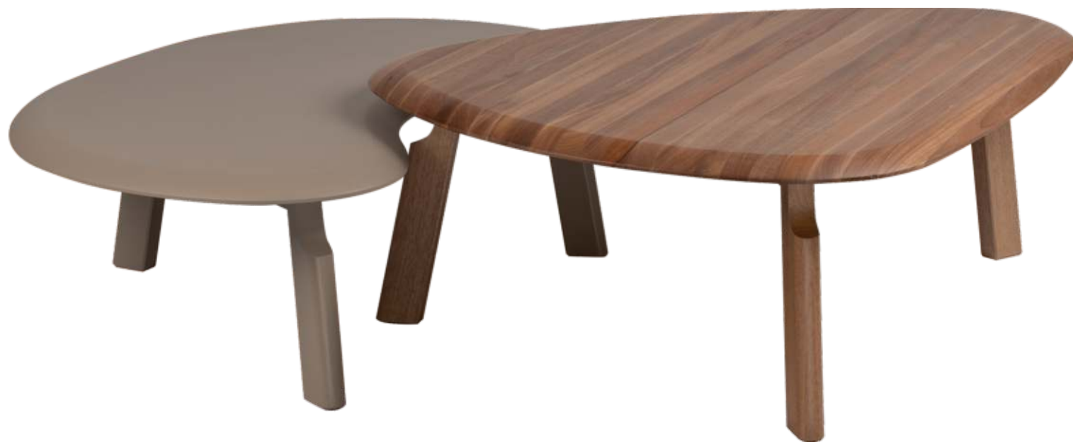
FOTO TREB2305 EM TRO80 FOTO TREB2305A EM JEQUITIBÁ NATURAL PHOTO TREB2305 IN TRO80 PHOTO TREB2305A IN JEQUITIBÁ WOOD FOTO TREB2305 EN TRO80 FOTO TREB2305A EN JEQUITIBÁ NATURAL