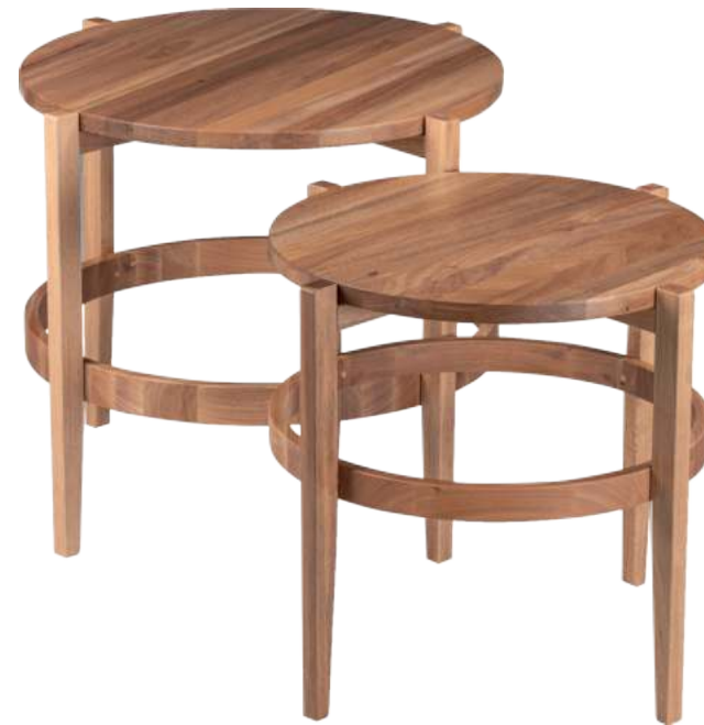
FOTO DO PRODUTO EM JEQUITIBÁ NATURAL PHOTO OF THE PRODUCT IN JEQUITIBÁ WOOD FOTO DEL PRODUCTO EN JEQUITIBÁ NATURAL

CxPxA / medidas em mm LxDxH / measures in mm CxPxA/ medidas en mm