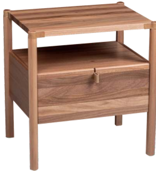
FOTO DO PRODUTO EM JEQUITIBÁ NATURAL PHOTO OF THE PRODUCT IN JEQUITIBA WOOD FOTO DEL PRODUCTO EN JEQUITIBÁ NATURAL

CxPxA / medidas em mm LxDxH / measures in mm CxPxA / medidas en mm