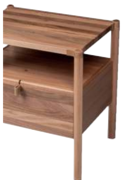
FOTO DO PRODUTO EM JEQUITIBÁ NATURAL PHOTO OF THE PRODUCT IN JEQUITIBA WOOD FOTO DEL PRODUCTO EN JEQUITIBÁ NATURAL