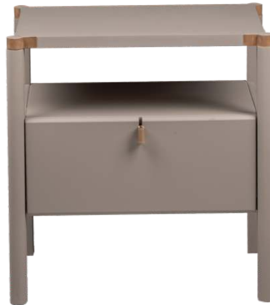
FOTO DO PRODUTO EM MDF TRO80 PHOTO OF THE PRODUCT IN MDF TRO80 FOTO DEL PRODUCTO EN MDF TRO80