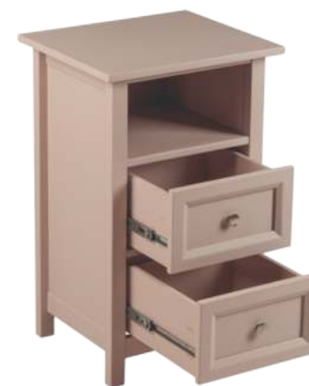
FOTO DO PRODUTO EM MDF TR052 PHOTO OF THE PRODUCT IN MDF TR052 FOTO DEL PRODUCTO EN MDF T-052