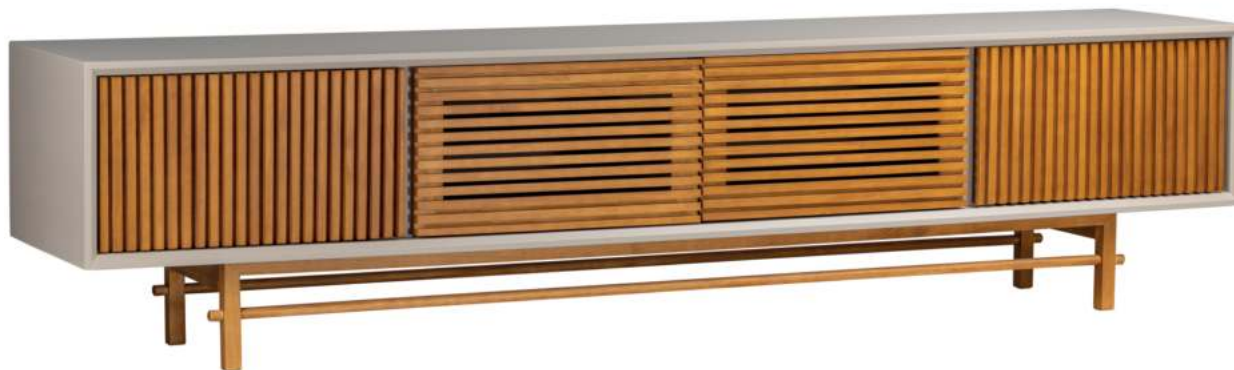
FOTO DO PRODUTO: CAIXA EM TR052, PORTAS E PÉS EM TR001. PRODUCT PHOTO: BOX IN TR052, DOORS AND FEET IN TR001. FOTO DO PRODUCTO: CAJA EN TR052, PUERTAS Y PIES EN TR001.