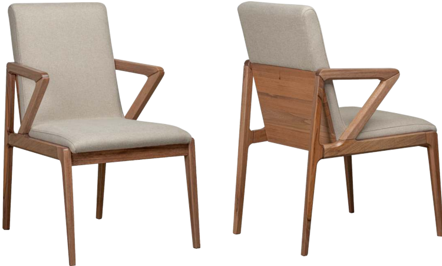
FOTO DO PRODUTO EM JEQUITIBÁ NATURAL TECIDO 0062618 PHOTO OF THE PRODUCT IN JEQUITIBÁ WOOD FABRIC 0062618 FOTO DEL PRODUCTO EN JEQUITIBÁ NATURAL TEJIDO 0062618

CxPxA / medidas em mm LxDxH / measures in mm CxPxA / medidas en mm