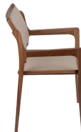
FOTO DO PRODUTO JEQUITIBÁ NATURAL. TECIDO 0014877. PICTURE UNIT IN JEQUITIBA WOOD. FABRIC 0014877. FOTO DEL PRODUCTO EN JEQUITIBÁ NATURAL. TEJIDO 0014877.