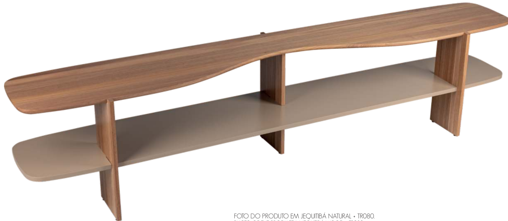
FOTO DO PRODUTO EM JEQUITIBÁ NATURAL + TR080. PHOTO OF THE PRODUCT IN JEQUITIBÁ WOOD + TR080. FOTO DEL PRODUCTO EN JEQUITIBÁ NATURAL + TR080.

CxPxA / medidas em mm LxDxH / measures in mm CxPxA / medidas en mm