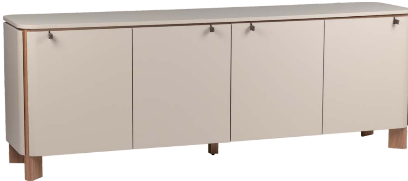
FOTO DO PRODUTO EM TRO52 PÉS EM JEQUITIBÁ NATURAL PHOTO OF THE PRODUCT IN TRO52 FEET IN JEQUITIBÁ WOOD FOTO DEL PRODUCTO EN TRO52 PIES EN JEQUITIBÁ NATURAL

CxPxA / medidas em mm LxDxH / measures in mm CxPxA / medidas en mm