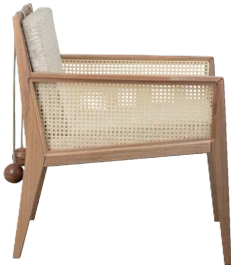
FOTO DO PRODUTO EM JEQUITIBÁ NATURAL TECIDO 0062615 PHOTO OF THE PRODUCT IN JEQUITIBÁ WOOD FABRIC 0062615 FOTO DEL PRODUCTO EN JEQUITIBÁ NATURAL TEJIDO 0062615