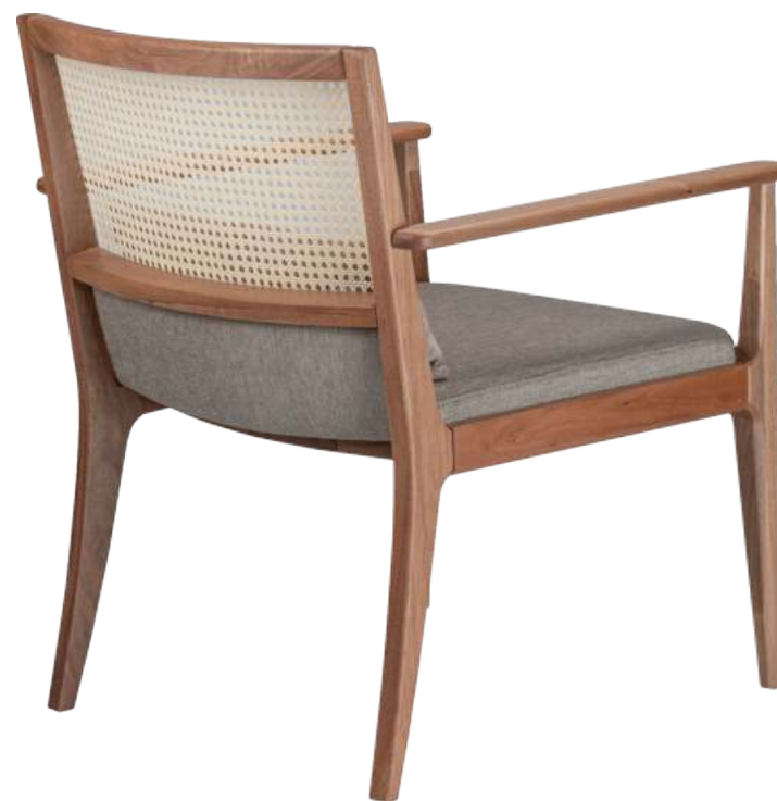
FOTO DO PRODUTO EM JEQUITIBÁ NATURAL TECIDO 0016242 PHOTO OF THE PRODUCT IN JEQUITIBÁ WOOD FABRIC 0016242 FOTO DEL PRODUCTO EN JEQUITIBÁ NATURAL TEJIDO 0016242