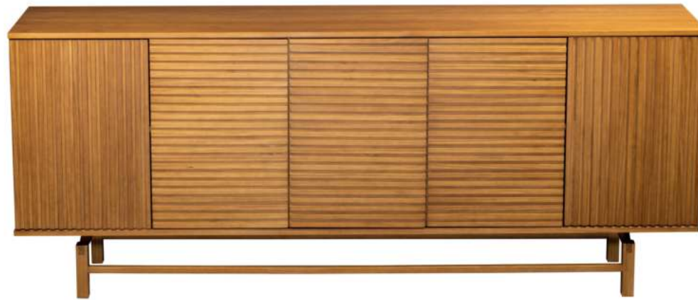
FOTO DO PRODUTO EM TRO01. PRODUCT PHOTO IN TRO01. FOTO DO PRODUCTO EN TRO01.

FOTO DO PRODUTO: CAIXA EM TRO52, PORTAS E PÉS EM JEQUITIBÁ NATURAL PRODUCT PHOTO: BOX IN TRO52, DOORS AND FEET IN WOOD JEQUETIBÁ FOTO DO PRODUCTO: CAJA EN TRO52, PUERTAS Y PIES EN JEQUITIBÁ NATURAL