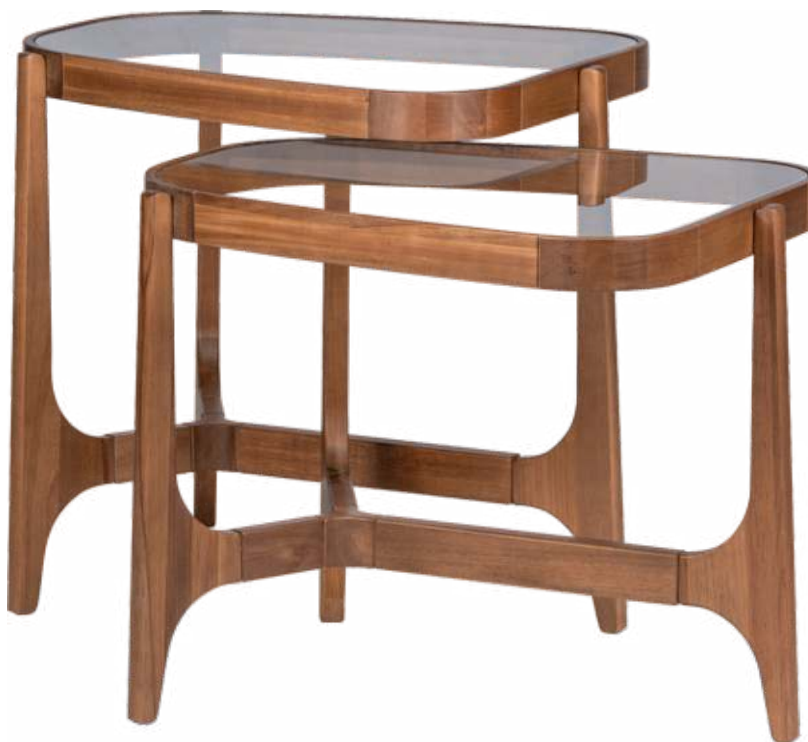
FOTO DO PRODUTO EM JEQUITIBÁ CAPPUCCINO PHOTO OF THE PRODUCT IN JEQUITIBÁ CAPPUCCINO FOTO DEL PRODUCTO EN JEQUITIBÁ CAPPUCCINO