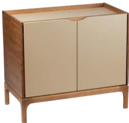
FOTO DO PRODUTO: PÉS E CORPO EM TR071. PORTAS E TAMPO EM TR052. PICTURED UNIT: FEET AND BODY IN TR071. DOORS AND TOP IN TR052. FOTO DEL PRODUCTO: PIES Y PUERTAS DE TR071. PUERTAS Y TECHO DE TR052.

CxPxH / medidas em mm LxDxH / measures in mm CxPxH / medidas en mm