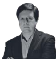
Designer Jair Barreto

FOTO DO PRODUTO JEQUITIBÁ NATURAL. TECIDO 0014877. PICTURE UNIT IN JEQUITIBA WOOD. FABRIC 0014877. FOTO DEL PRODUCTO EN JEQUITIBÁ NATURAL. TEJIDO 0014877.