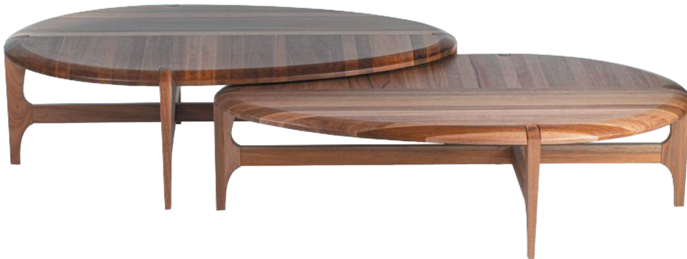
FOTO DO PRODUTO EM JEQUITIBÁ NATURAL PHOTO OF THE PRODUCT IN JEQUITIBÁ WOOD FOTO DEL PRODUCTO EN JEQUITIBÁ NATURAL

CxPxA / medidas em mm LxDxH / measures in mm CxPxA / medidas em mm