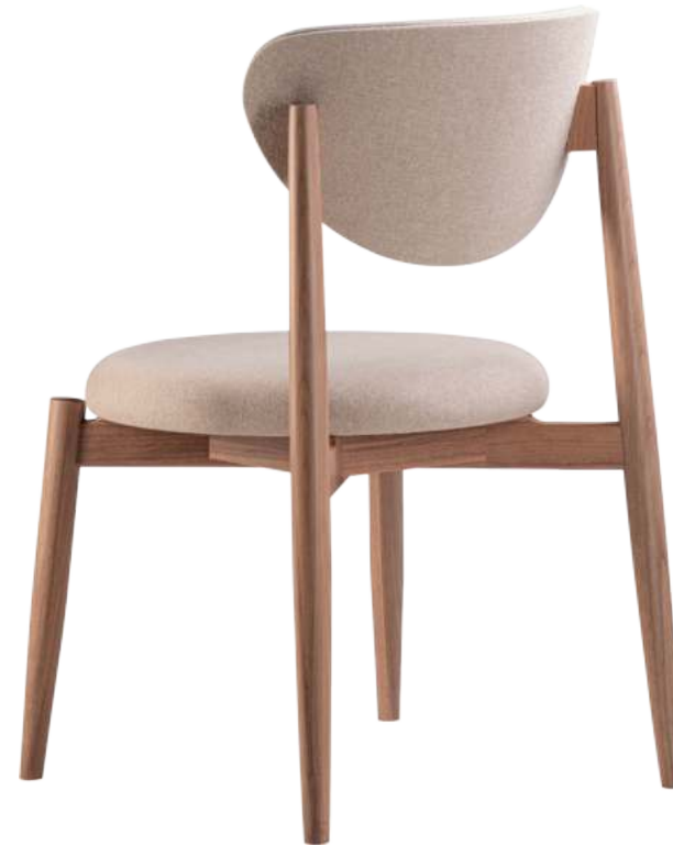
FOTO DO PRODUTO EM JEQUITIBÁ NATURAL TECIDO 0062618 PHOTO OF THE PRODUCT IN JEQUITIBÁ WOOD FABRIC 0062618 FOTO DEL PRODUCTO EN JEQUITIBÁ NATURAL TEJIDO 0062618