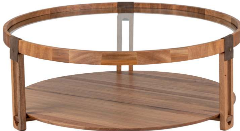
FOTO DO PRODUTO EM JEQUITIBÁ NATURAL. DETALHES EM COURO NATURAL. PHOTO OF THE PRODUCT IN JEQUITIBÁ WOOD DETAILS IN NATURAL LEATHER. FOTO DEL PRODUCTO EN JEQUITIBÁ NATURAL DETALLES EN CUERO NATURAL.