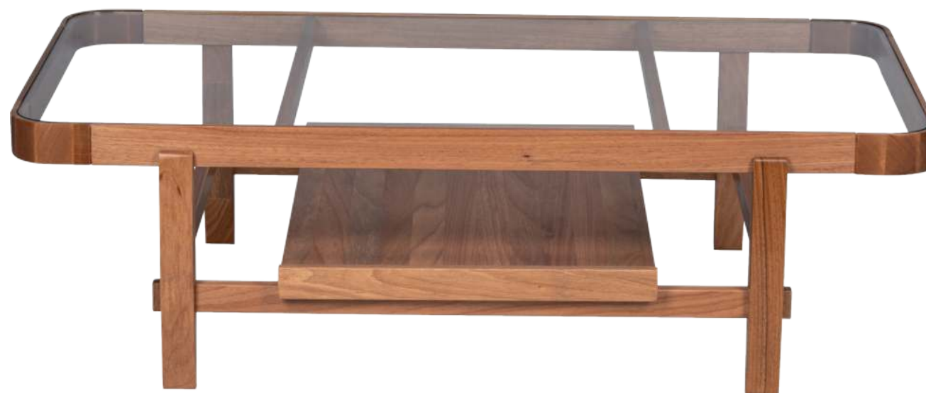
FOTO DO PRODUTO EM JEQUITIBÁ NATURAL PHOTO OF THE PRODUCT IN JEQUITIBÁ WOOD FOTO DEL PRODUCTO EN JEQUITIBÁ NATURAL