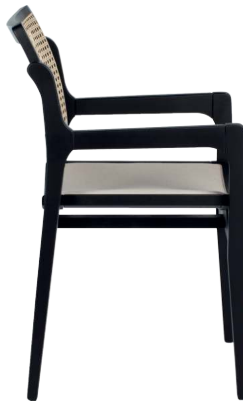
FOTO DO PRODUTO EM TRO09. TECIDO 0030741.PALHA ABERTA PICTURE UNIT IN TRO09. FABRIC 0030741.OPEN STRAW. FOTO DEL PRODUCTO DE TRO09. TEJIDO 0030741.PAJA ABIERTA.