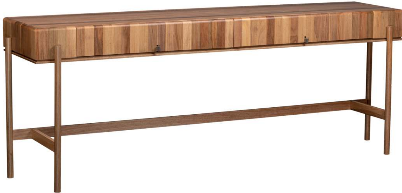
FOTO DO PRODUTO EM JEQUITIBÁ NATURAL PHOTO OF THE PRODUCT IN JEQUITIBÁ WOOD FOTO DEL PRODUCTO EN JEQUITIBÁ NATURAL

CxPxA / medidas em mm LxDxH / measures in mm CxPxA / medidas en mm