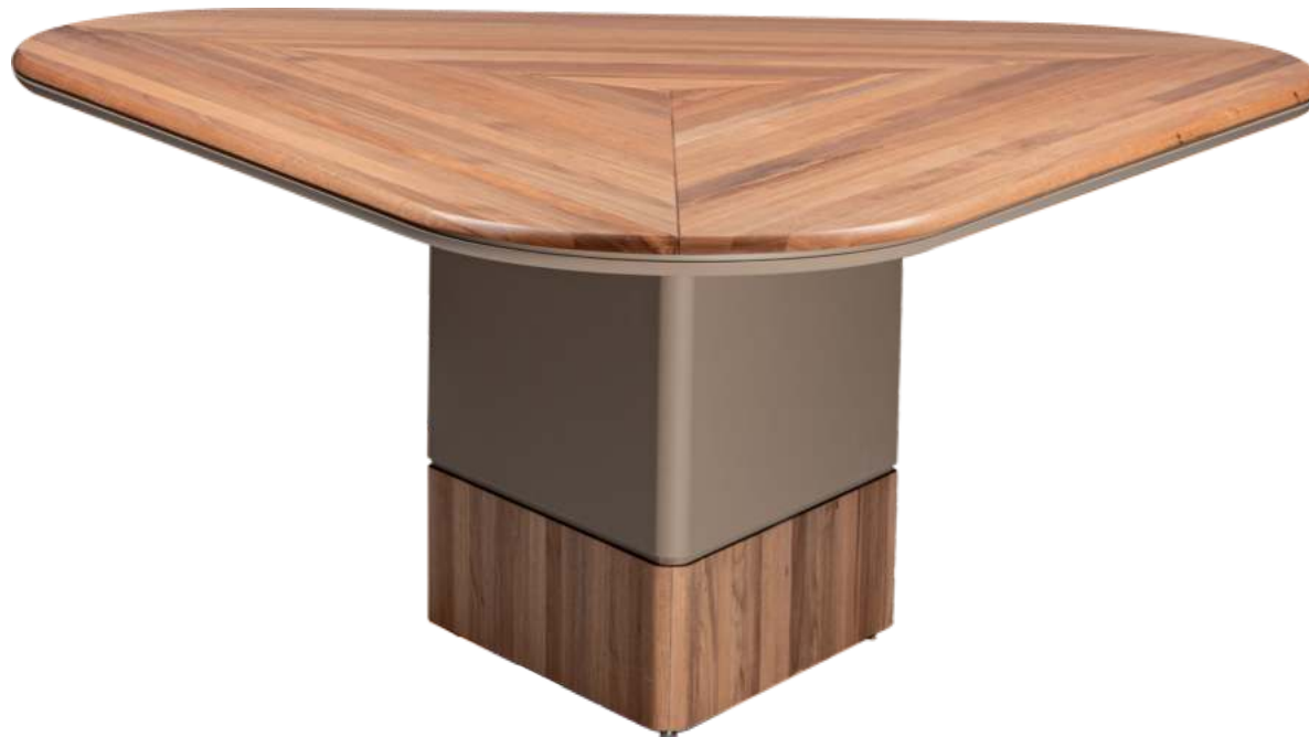
FOTO DO PRODUTO EM JEQUITIBÁ NATURAL + TR052 PHOTO OF THE PRODUCT IN JEQUITIBÁ WOOD + TR052. FOTO DEL PRODUCTO EN JEQUITIBÁ NATURAL + TR052.

CxPxA / medidas em mm LxDxH / measures in mm CxPxAl / medidas en mm