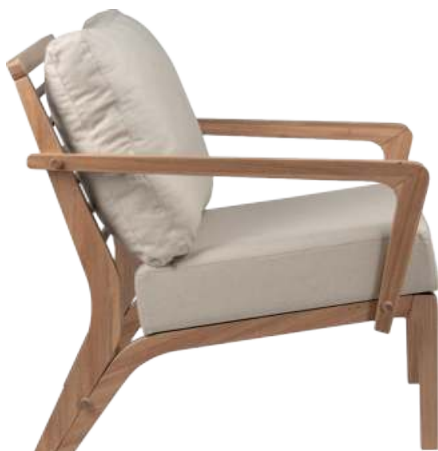
FOTO DO PRODUTO EM EM JEQUITIBÁ NATURAL. TECIDO 0031016. PICTURE UNIT IN JEQUITIBÁ WOOD. FABRIC 0031016. FOTO DEL PRODUCTO EN JEQUITIBÁ NATURAL. TEJIDO 0031016.