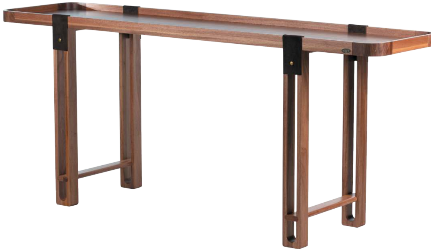
FOTO DO PRODUTO EM JEQUITIBÁ NATURAL PHOTO OF THE PRODUCT IN JEQUITIBÁ WOOD FOTO DEL PRODUCTO EN JEQUITIBÁ NATURAL