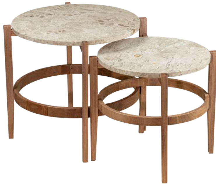
FOTO DO PRODUTO EM JEQUITIBÁ NATURAL; PEDRA NATURAL BEGE BAHIA ESCOVADO PHOTO OF THE PRODUCT IN JEQUITIBÁ WOOD ; BRUSHED BAHIA BEIGE NATURAL STONE FOTO DEL PRODUCTO EN JEQUITIBÁ NATURAL ; PIEDRA NATURAL BEIGE BAHIA CEPILLADA