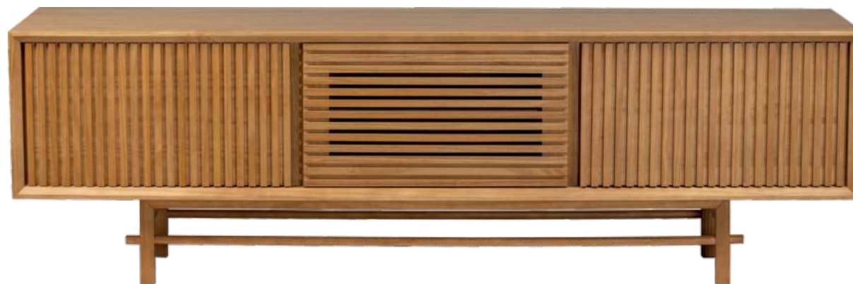
FOTO DO PRODUTO EM TR062 PHOTO OF THE PRODUCT IN TR062 FOTO DEL PRODUCTO EN TR062

FOTO DO PRODUTO: CAIXA EM TR052, PORTAS E PÉS EM TR001. PRODUCT PHOTO: BOX IN TR052, DOORS AND FEET IN TR001. FOTO DO PRODUCTO: CAJA EN TR052, PUERTAS Y PIES EN TR001.