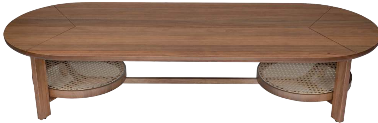
FOTO DO PRODUTO EM JEQUITIBÁ TR082 (CAPPUCCINO) PHOTO OF THE PRODUCT IN JEQUITIBÁ TR082 (CAPPUCCINO) FOTO DEL PRODUCTO EN JEQUITIBÁ TR082 (CAPPUCCINO)