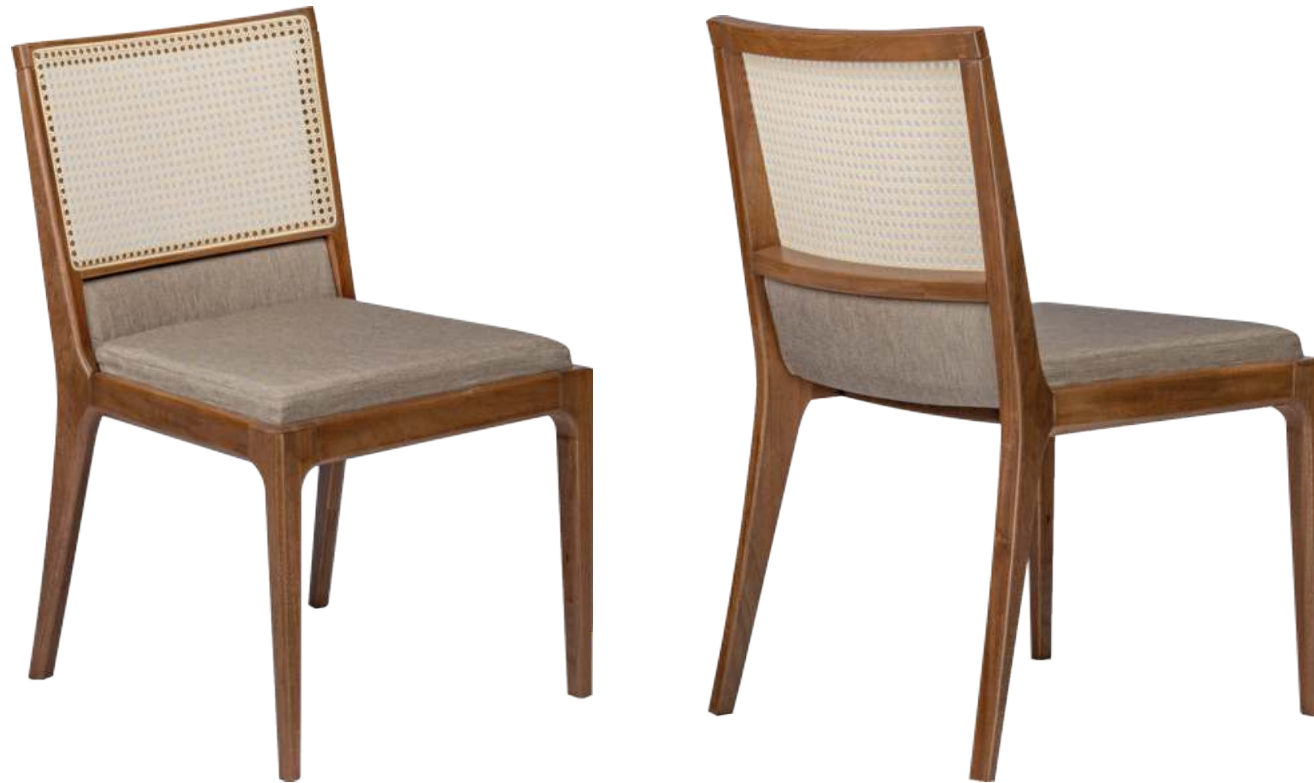
FOTO DO PRODUTO EM TR082 (CAPPUCINO) TECIDO 0016242. PALHA ABERTA. PICTURE UNIT IN JEQUITIBÁ TR082 (CAPPUCINO) FABRIC 0016242. PEN STRAW. FOTO DEL PRODUCTO EN JEQUITIBÁ TR082 (CAPPUCINO) TEJIDO 0016242. PAJA ABIERTA.