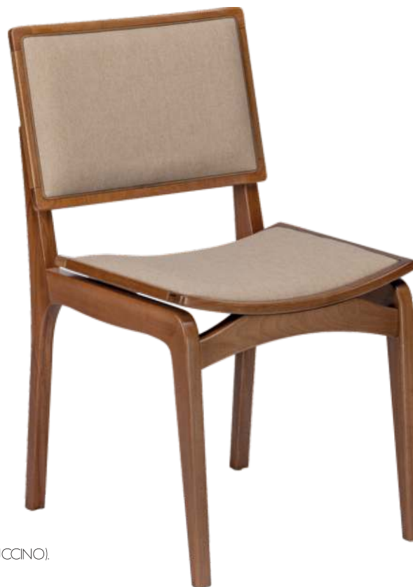
FOTO DO PRODUTO EM TR082 (CAPPUCCINO). TECIDO 0031017. PICTURE UNIT IN TR082 (CAPPUCCINO). FABRIC 0031017. FOTO DEL PRODUCTO DE TR082 (CAPPUCCINO). TEJIDO 0031017.