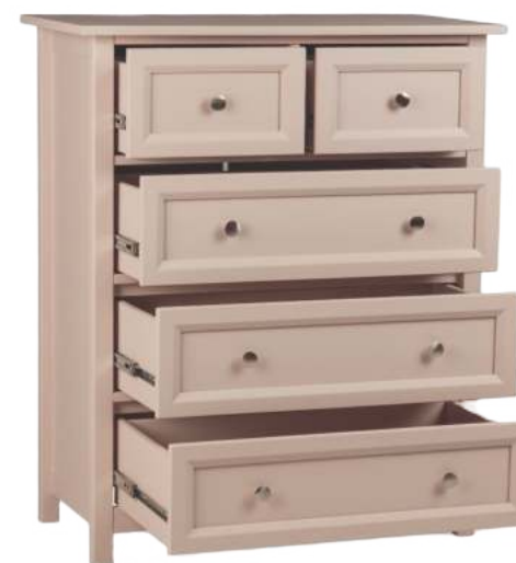
FOTO DO PRODUTO EM MDF TR052 PHOTO OF THE PRODUCT IN MDF TR052 FOTO DEL PRODUCTO EN MDF T-052