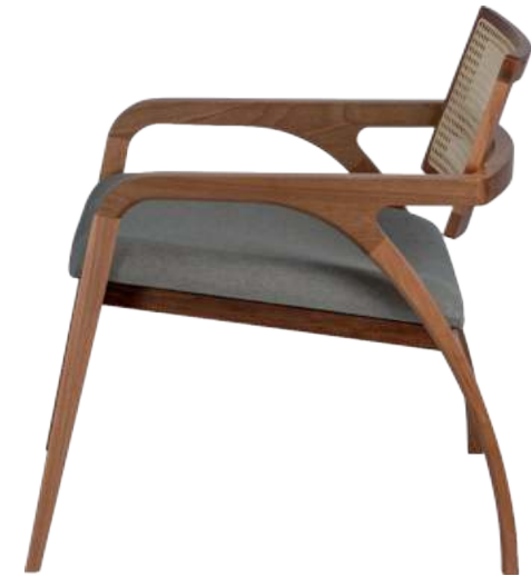
FOTO DO PRODUTO EM JEQUITIBÁ NATURAL TECIDO 0031019 PHOTO OF THE PRODUCT IN JEQUITIBA WOOD FABRIC 0031019 FOTO DEL PRODUCTO EN JEQUITIBÁ NATURAL TEJIDO 0031019