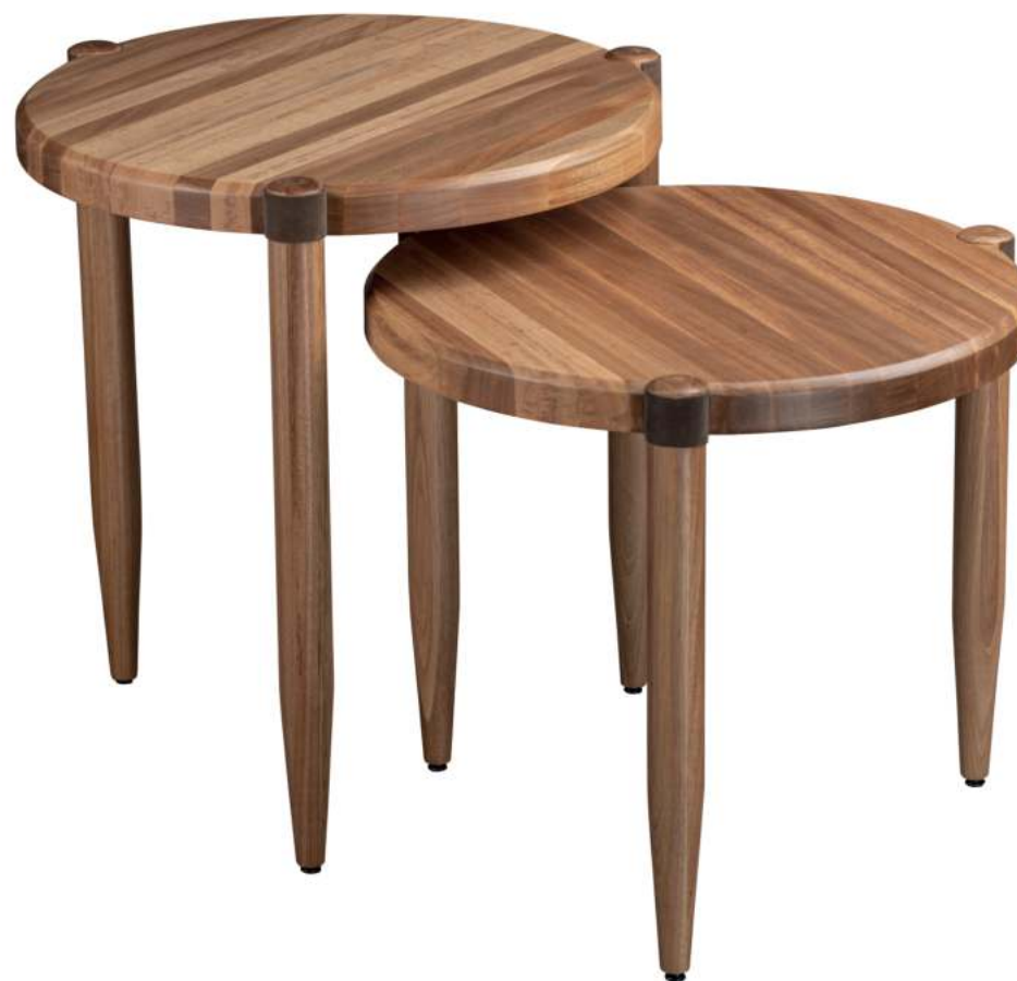
FOTO DO PRODUTO EM JEQUITIBÁ NATURAL PHOTO OF THE PRODUCT IN JEQUITIBÁ WOOD FOTO DEL PRODUCTO EN JEQUITIBÁ NATURAL

CxPxA / medidas em mm LxDxH / measures in mm CxPxA / medidas en mm