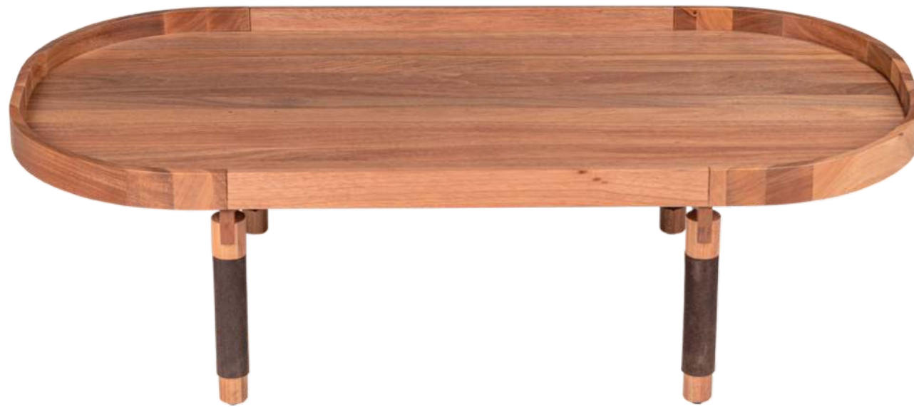
FOTO DO PRODUTO EM JEQUITIBÁ NATURAL PHOTO OF THE PRODUCT IN JEQUITIBÁ WOOD FOTO DEL PRODUCTO EN JEQUITIBÁ NATURAL

CxPxH / medidas em mm LxDxH / measures in mm CxPxH / medidas en mm